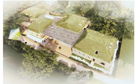
Computeranimation: Copyright Partner und Partner Architekten, JUCA Landschaft und Architektur