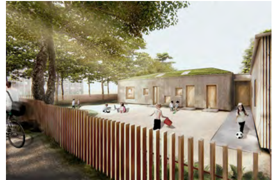
Computeranimation: Copyright Partner und Partner Architekten, JUCA Landschaft und Architektur