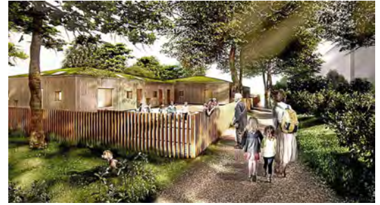
Computeranimation: Copyright Partner und Partner Architekten, JUCA Landschaft und Architektur