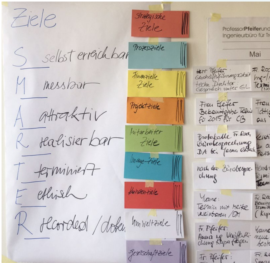
Auszug aus der Fotodokumentation einer Workshopreihe „Ziele“ mit den Mitarbeitern der Niederlassung Cottbus unter Leitung der Autorin